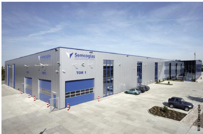
Auf 7.000 Quadratmeter Nutzfläche verfügt Sencoglas in Kropp neben modernster Zuschnittstechnik über zwei Isolierglaslinien.