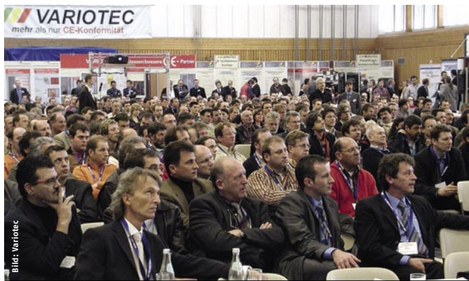
Bis zu 900 Teilnehmer kamen zu den letzten Variotec-Innovationstagen.

Variotec lädt Architekten, Planer, Ingenieure, Schreiner, Fenster- und Türenbauer sowie den Handel zu den sechsten „Innovationstagen“ ins fränkische Feucht ein. Am 21. und 22. Januar 2010 geben mehr als 20 hochkarätige Referenten in der „Reichswaldhalle“ einen Überblick über die Zukunft des energieeffizienten und nachhaltigen Bauens.